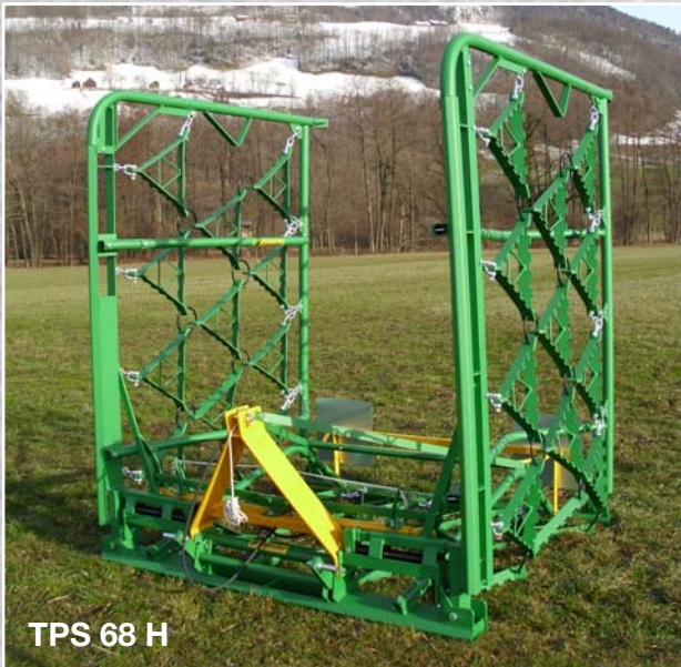
TPS 68 H

CH-9466 Sennwald Produktion: Industriestr. 2, 9464 Lienz Tel. 071 766 25 53 Lienz Fax 071 766 25 54 Lienz info@faessler-landtechnik.ch www.faessler-landtechnik.ch