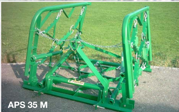
APS 35 M

Le profil du cadre nouvellement développé ne s'accroche pas aux corps fixes (pierres etc.), ceci contrairement aux profils anguleux ou profils U. Il permet de travailler avec un 3ème-Points à chaîne s'adaptant parfaitement au terrain. Les machines en jeu de construction et le cadre vissé en groupes permettent une réparation sans soudage.