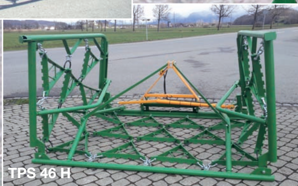
TPS 46 H

Pièce d'usure en Acier - moins d'usure par rapport à une pièce en fonte