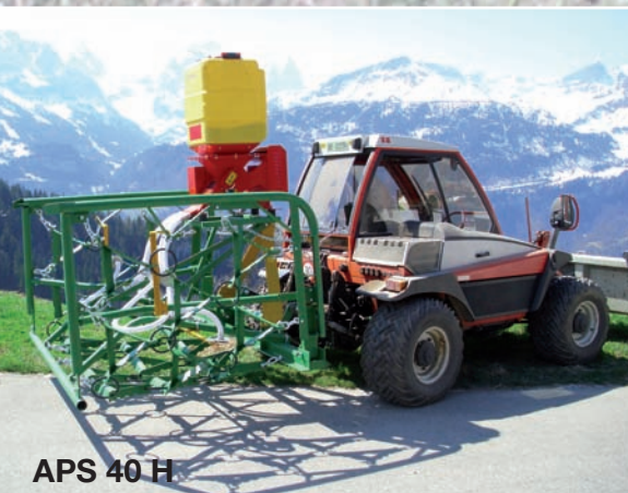
APS 40 H