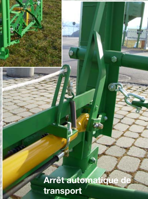
Arrêt automatique de transport