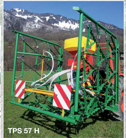
TPS 57 H